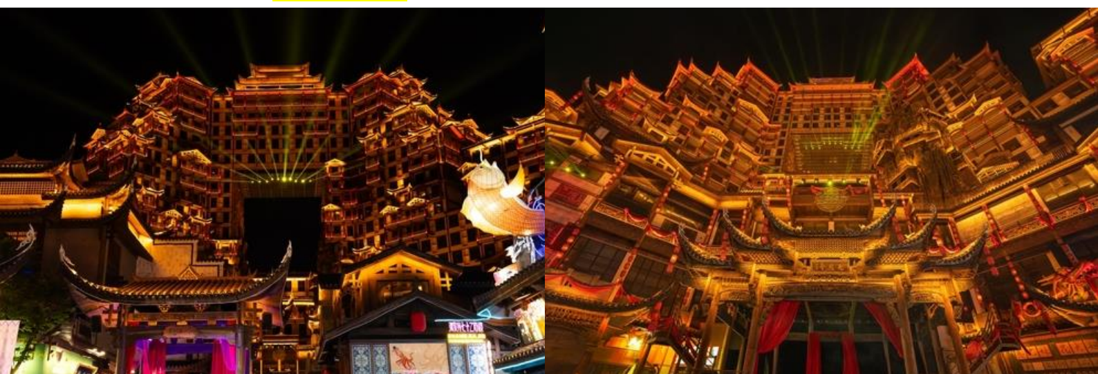
นำทุกท่านเข้าสู่ที่พัก MELLOW HOTEL ระดับ 4 ดาวท้องถิ่นหรือเทียบเท่า

20.20 เดินทางถึง ท่าอากาศยานต้าหยง เมืองจางเจี๋ยเจี๋ย ประเทศจีน (เวลาท้องถิ่นเร็วกว่าประเทศไทย 1 ชั่วโมง) นำท่านผ่านขั้นตอนการตรวจหนังสือเดินทาง และตรวจรับสัมภาระเรียบร้อย นำท่านเดินทางโดยรถบัสนำท่านสู่ เมืองจางเจี๋ยเจี๋ย หรือ เมืองต้าหยง เป็นหนึ่งในเมืองท่องเที่ยวที่สำคัญที่สุดของจีนซึ่งลือชื่อด้วยทรัพยากรการท่องเที่ยวที่มีเอกลักษณ์ของตนเองแหล่งท่องเที่ยวสำคัญใน เมืองจางเจี๋ยเจี๋ยเป็นพื้นที่ป่าไม้ถึง 98% ซึ่งนับเป็นออกซิเจนทางธรรมชาติและเนื่องจากเป็นเมืองที่อยู่ห่างไกลที่น้อยคนจะเดินทางไป ถึงอีกทั้งชาวจางเจี๋ยเจี๋ยผู้ซึ่งรักในธรรมชาติได้ดำเนินนโยบายอนุรักษ์ธรรมชาติอย่างมีประสิทธิภาพ เมืองจางเจี๋ยเจี๋ยจึงประดิษฐานดินแดนบริสุทธิ์ของโลกที่แห่งนี้ยังเป็นแหล่งชุมชนของ 33 ชนเผ่า เช่น ชนเผ่าถู่เจี๋ย ชนเผ่าไป๋ และชนเผ่าเหมียว สภาพภูมิศาสตร์ที่มีเอกลักษณ์ทำให้วัฒนธรรมของชนเผ่าต่างๆได้รับการอนุรักษ์เป็นอย่างดี จากนั้นนำท่านชม ตึกมหัศจรรย์ 72 แห่งเมืองจางเจี๋ยเจี๋ย แลนด์มาร์คใหม่ล่าสุดที่เป็นเสมือนแม่เหล็กดึงดูดนักท่องเที่ยวและผู้มาเยือน ถูกสร้างขึ้นโดยนำเอาจุดเด่นของเมืองจางเจี๋ยเจี๋ยมารวมกัน โดยมีอาคารสูงที่สร้างจำลองถ้ำประตูสวรรค์ บ้านยกพื้นโบราณที่เป็นบ้านพื้นเมืองของชาวถู่เจี๋ย นอกจากนี้ที่นี่ยังถูกออกแบบให้กลายเป็นแหล่งรวมของ รีสอร์ท โฮมสเตย์ ร้านอาหาร ผังสตรีทฟู้ด ผับบาร์ ร้านขายของที่ระลึก ที่ตกแต่งด้วยแสงสีสุดอลังการ (รวมบัตรเข้าชม)