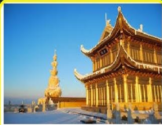
ยอดเขาจินตัง