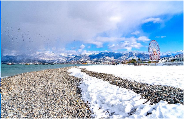
เที่ยว อีสรอาหารเพื่อความสะดวกในการท่องเที่ยว