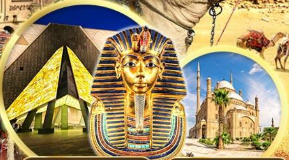
พิพิธภัณฑ์แกรนด์อียิปต์ บิอมปราการซาลาดิน

เข้าชม 2 พิพิธภัณฑ์ GRAND EGYPTIAN MUSEUM & NMEC พิพิธภัณฑ์โบราณคดีใหม่และพิพิธภัณฑ์จัดแสดงมัมมี่