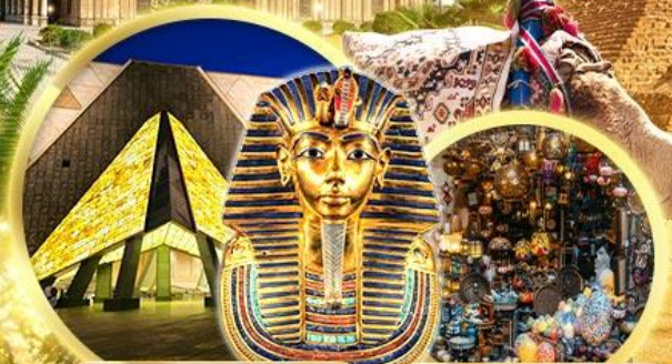
พิพิธภัณฑ์แกรนด์อียิปต์